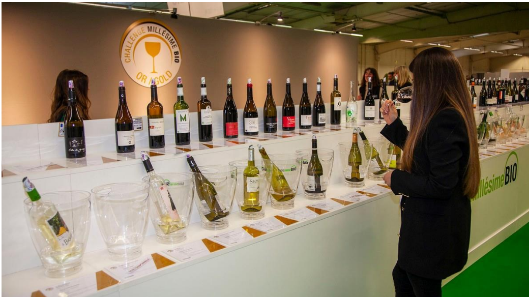
Les médailles sont aussi à l'honneur (Photo Archives SudVinBio).

Les stands ne sont pas regroupés par région ou par appellation, mais mélangés. Cette caractéristique de Millésime BIO est un choix délibéré des organisateurs afin de favoriser la rencontre et la curiosité. Cela peut sembler déroutant au premier abord, mais la signalétique, les services digitaux et le personnel d'accueil sont là pour vous guider dans votre parcours de dégustation. La grande majorité des exposants est en mesure de présenter les nouveautés du millésime de l'année.